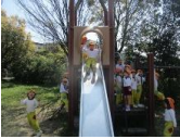
滑り台は園にもありますが子ども達にはまた違った感覚のようでした