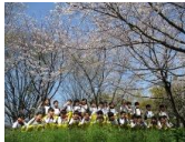
春を満喫しました！