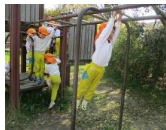
雲梯は毎年大人気！