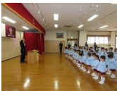
幼児クラス進級式。新しいクラスでもみんながんばってね！