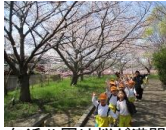
包近公園は桜が満開！