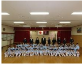
幼児3クラスの子ども達。希望に満ちた表情でした

本日4月1日より令和8年度がスタートしました。今日は朝から新入園児さんと保護者の皆様をお迎えし入園式を行いました。式典には年度初めの平日にも関わらず、多くの新入園児保護者の皆様にご参列頂きありがとうございました。明日2日より、新入園児さんを含めた教育・保育が始まりますが、ほとんどの新入園児さんは保護者の皆様のもとを離れる経験がないため、大きな不安を感じ泣いての登園になることと思いますが、少しでも不安が和らげられるよう、一人ひとりに応じた無理のない保育を進めて参ります。これから先生やお友達のあそぶ姿や行動に興味を持ち、次第に園生活に慣れていくと思いますので、ご家庭でも今日楽しかったこと、また給食のことなどお子様とたくさんお話してあげて下さいね。子ども達が一日でも早く園の生活に慣れ、心身ともに健やかな生活が送れるよう、保護者の皆様とともに教育・保育を進めて参りますので、これから一年どうぞよろしくお願い申し上げます。