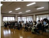
入園式。これからよろしく願いいたします