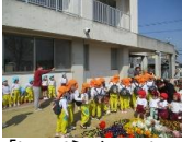
「いってらっしゃーい！」お見送りを受けながら出発