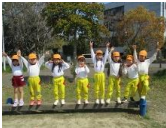
一ツ橋も順番待ちをするほどの人気でした